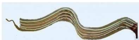
Biberkraft-VLIESmitS® BRAA-Doppel "S"

Biberkraft VLIESmitS® werkt al bij de eerste regendruppel. De zwavel, door het water meegevoerd, vormt in contact met koper, kopersulfaat. Dit wordt door het regenwater opgenomen en vloeit sterk verdund over het hele dak. Biberkraft VLIESmitS® heeft ook het onschatbare voordeel, dat dit het enige dakreinigingssysteem is, dat zo nodig na jaren met zwavel bijgevoerd kan worden.